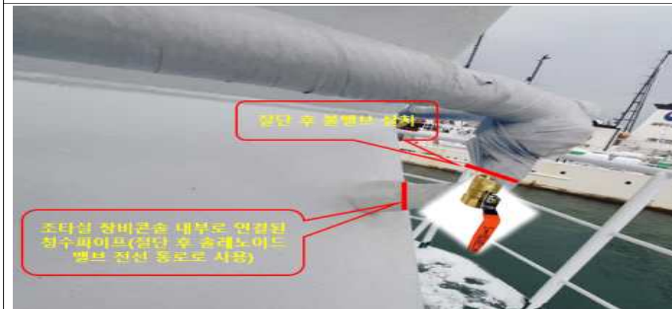
작업 모식도 3