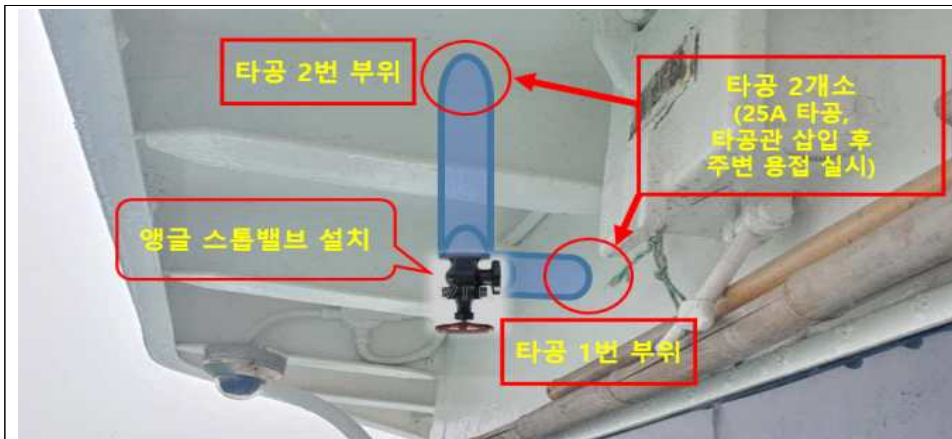
작업 모식도 1